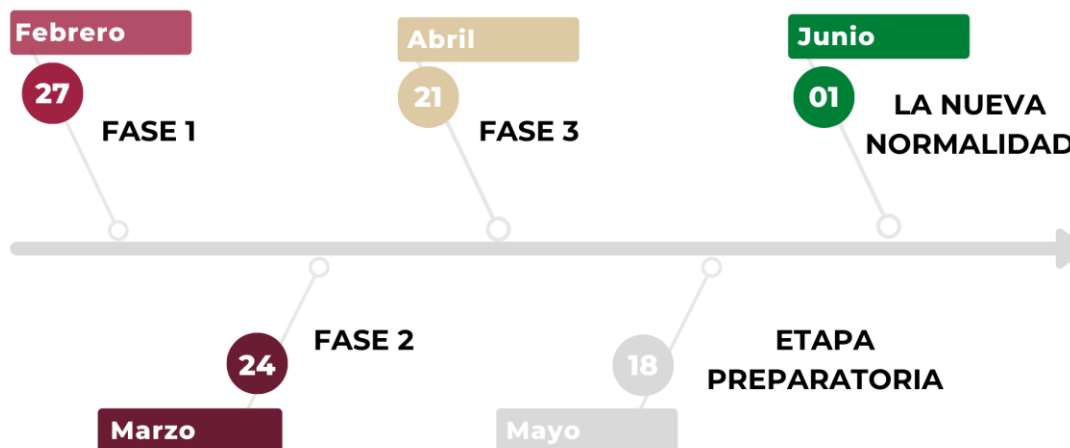
Diagrama 1. Fases para la nueva normalidad

Primera etapa. Tiene inicio el día 18 de mayo y comprende los Municipios de la Esperanza, los cuales no tienen contagios reportados por SASR-CoV-2, y ni vecindad con municipios con contagios. En estas localidades se dará apertura a toda la actividad laboral.